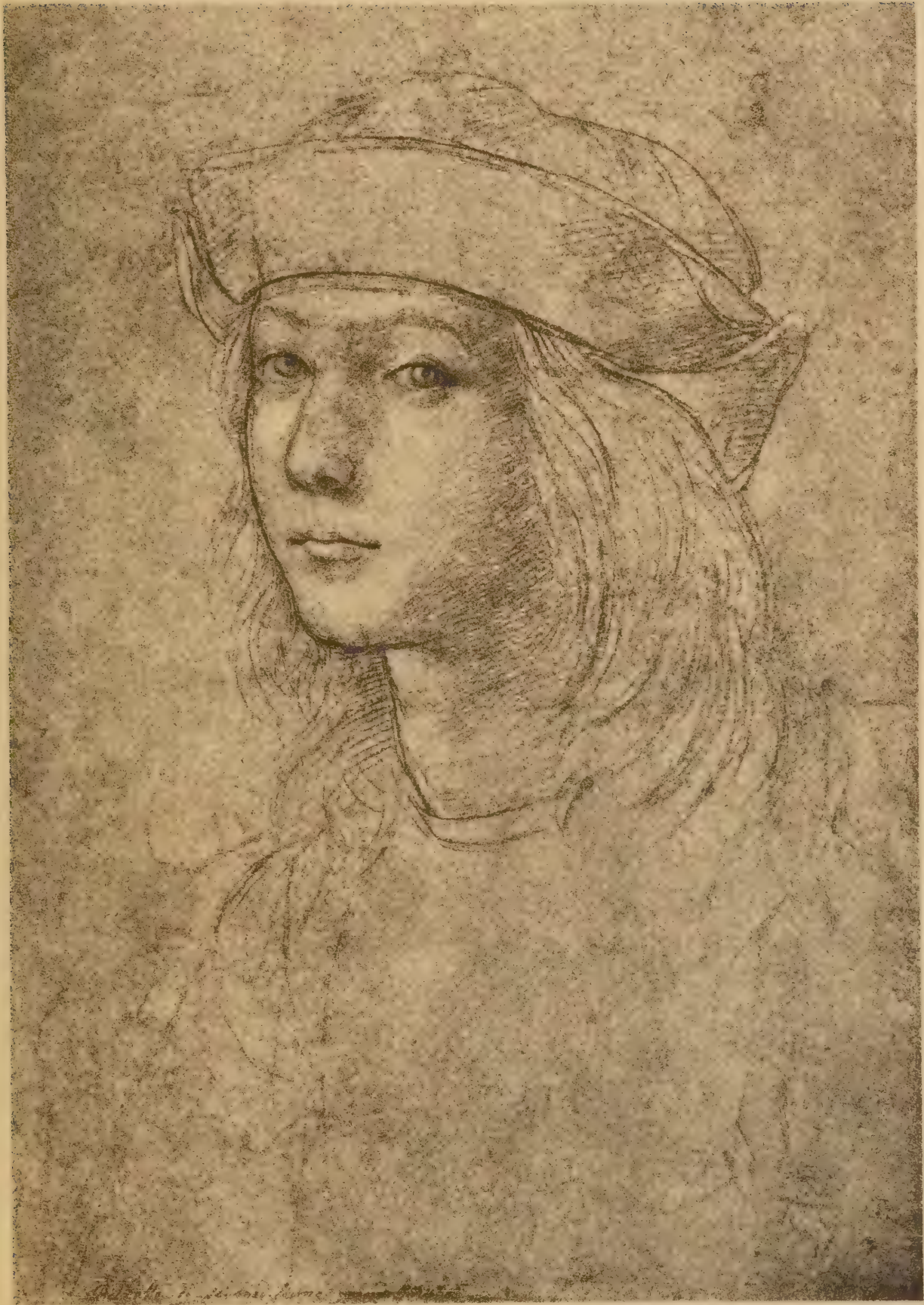
Portrait de Raphaël à 16 ans